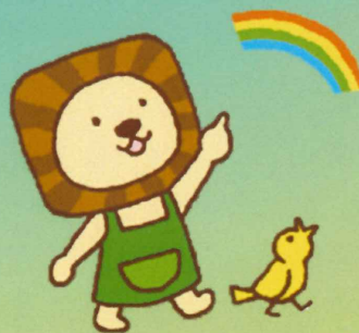
北海道福祉人材センター

高齢者、障がいをお持ちの方への福祉サービスを提供している法人です。原点は、ご利用者にとっても職員にとっても、あたたかい法人であること。あなたと一緒に、ご利用者の笑顔と職員、そして法人の明るい未来を創りたい！