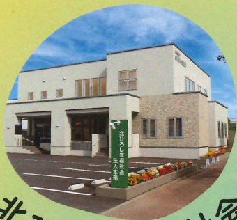
北ひろしま福祉会

北広島市内で障がい者支援事業、介護保険事業を運営している社会福祉法人です。通所・入所・児童・高齢など幅広く展開しています。活みなぎる北海道ボールパークFビレッジのまち北広島市で一緒に活躍してくれる仲間を大募集中です！