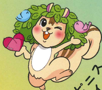
北海道ハピネス・グリーンパーク 和幸園

札幌市を中心に、芦別市、喜茂別町、俣知安町で障がい者・高齢者・児童福祉事業等を運営しています。子どもも高齢者も障がいのある方も、やさしくなごやかにともに生きていく。そんな豊かな社会の実現を目指しています。