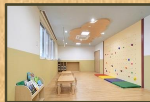
ボルダリングスペース