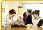
株式会社健康会 求人サイトはこちらから