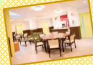
医療法人社団 栄会 HPはこちらから